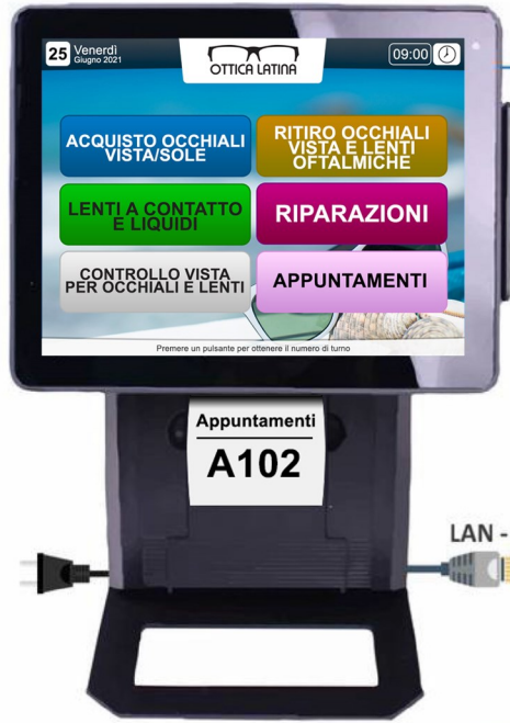
QS-MICROTOUCH erogatore termico con display touch da 9.7"

Erogatore termico con touch screen da 9.7" - Display principale LAN - Display di sportello LAN - Console virtuali