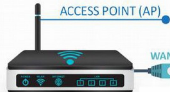
ACCESS POINT (AP)